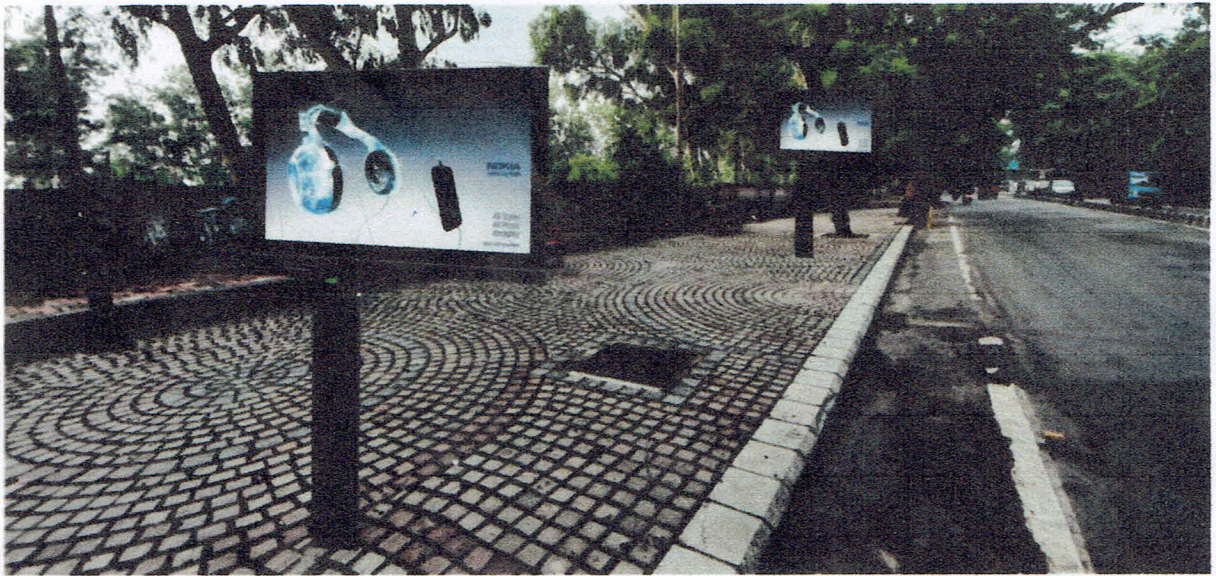
Pole mounted Glow Signs